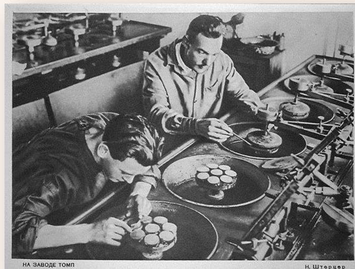
НА ЗАВОДЕ ТОМП